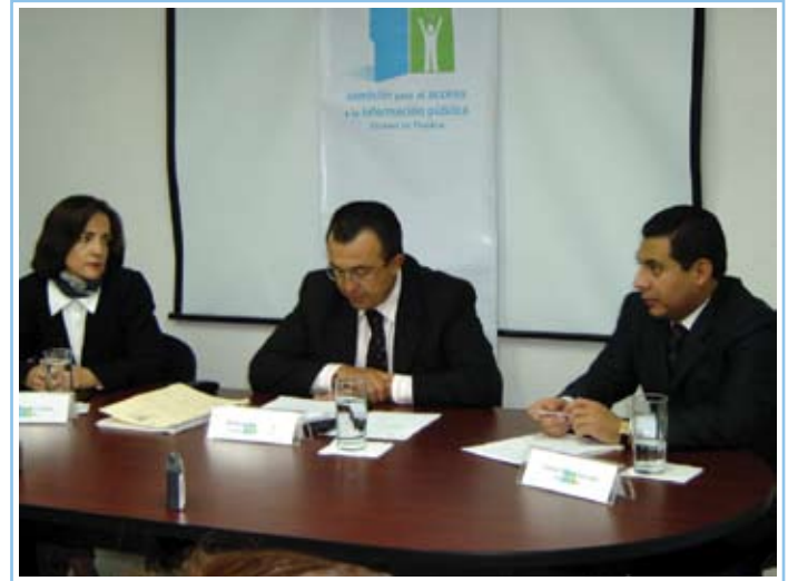
↑ Resolución de recurso de revisión en sesión pública del 1 de junio de 2006.