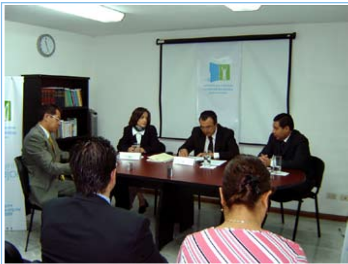
↑ Resolución de recurso de revisión en sesión pública del 1 de junio de 2006