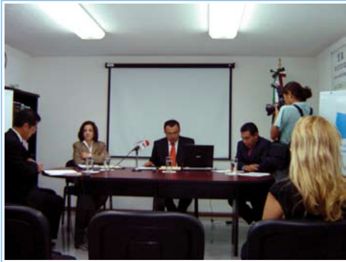
↑ Resolución de recurso de revisión en sesión pública del 18 de mayo de 2006