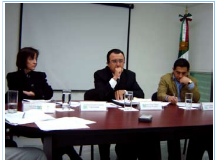
↑ Resolución de recurso de revisión en sesión pública del 27 de noviembre de 2006