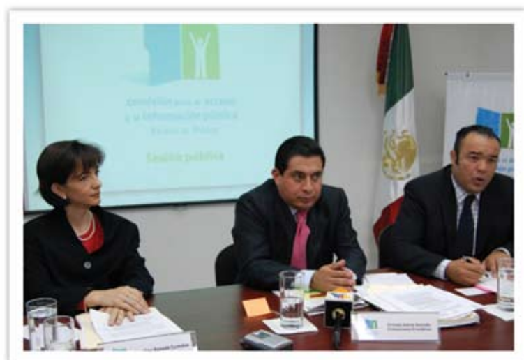
Aspectos de sesiones públicas del Pleno.