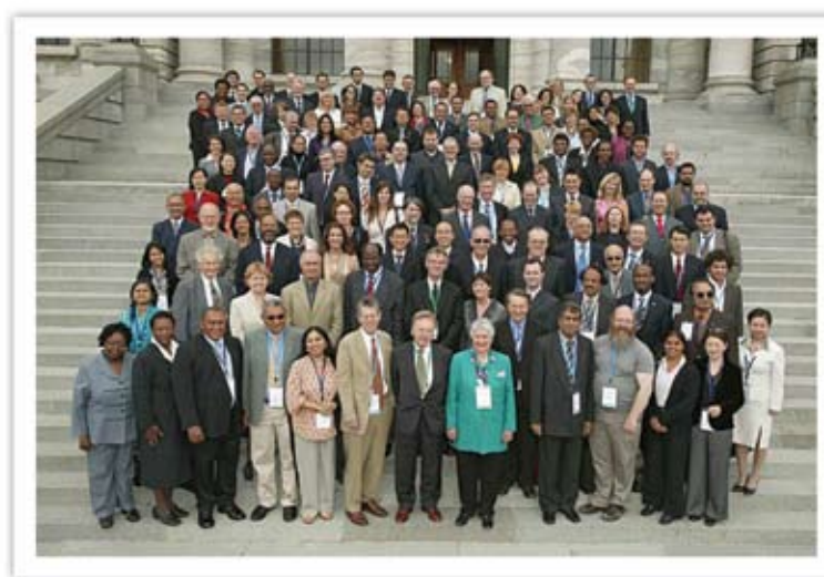
▲ Asistentes a la V Conferencia Internacional de Comisionados, en Nueva Zelanda.