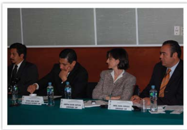
▲ Los tres comisionados en la presentación del Código de Buenas Prácticas en la Asamblea Legislativa del Distrito Federal.