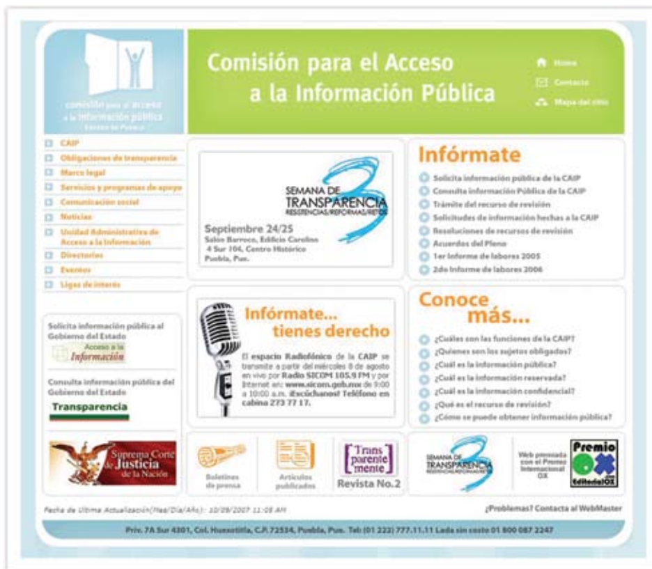
▲ Página web de la CAIP premiada por la editorial OX.

La Editorial OX es una editorial independiente, se encuentra presente alrededor del mundo a través de libros, conferencias, seminarios y premios con la finalidad de estimular el desarrollo de Internet en español.