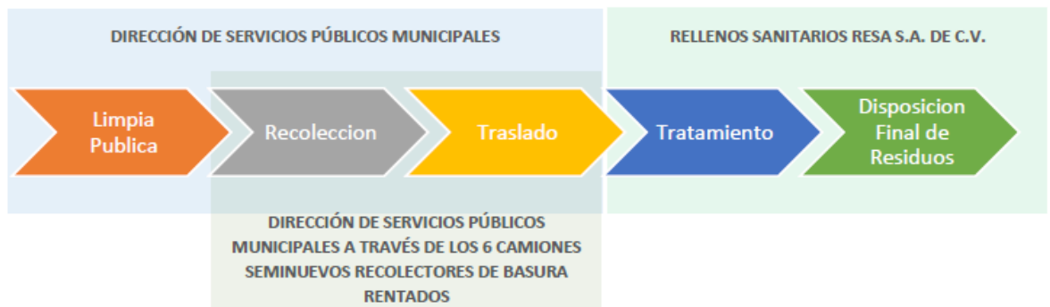
IMAGEN REPRESENTATIVA DEL CICLO EN EL PROCESO DE LIMPIA, RECOLECCIÓN, TRASLADO, TRATAMIENTO Y DISPOSICIÓN FINAL DE RESIDUOS

Al supuestamente desconocer, quien es el ENCARGADO DE LIMPIA PUBLICA; Sobre este punto quiero manifestar que el desconocimiento y la supuesta mala orientación de mis preguntas, como lo asevera el titular de la unidad de transparencia del municipio de Teziutlan Pue. Se debe a la mala orientación que las aéreas y sujetos obligados han dado a mi persona, muestra de lo anterior es lo siguiente. En mi petición 01147319 Misma que genera el actual recurso de revisión RR- 702 Mi persona solicito.