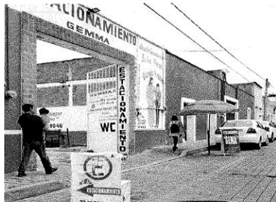
Estacionamiento ubicado en calle 5 entre av. Miguel Alemán y calle 2 Sur con una cuota de $15.00 pesos.

A continuación, en las imágenes se puede apreciar que la cuota de parquímetros es de un costo menor al de estacionamientos comerciales, ya que estos estacionamientos tienen una cuota más alta.